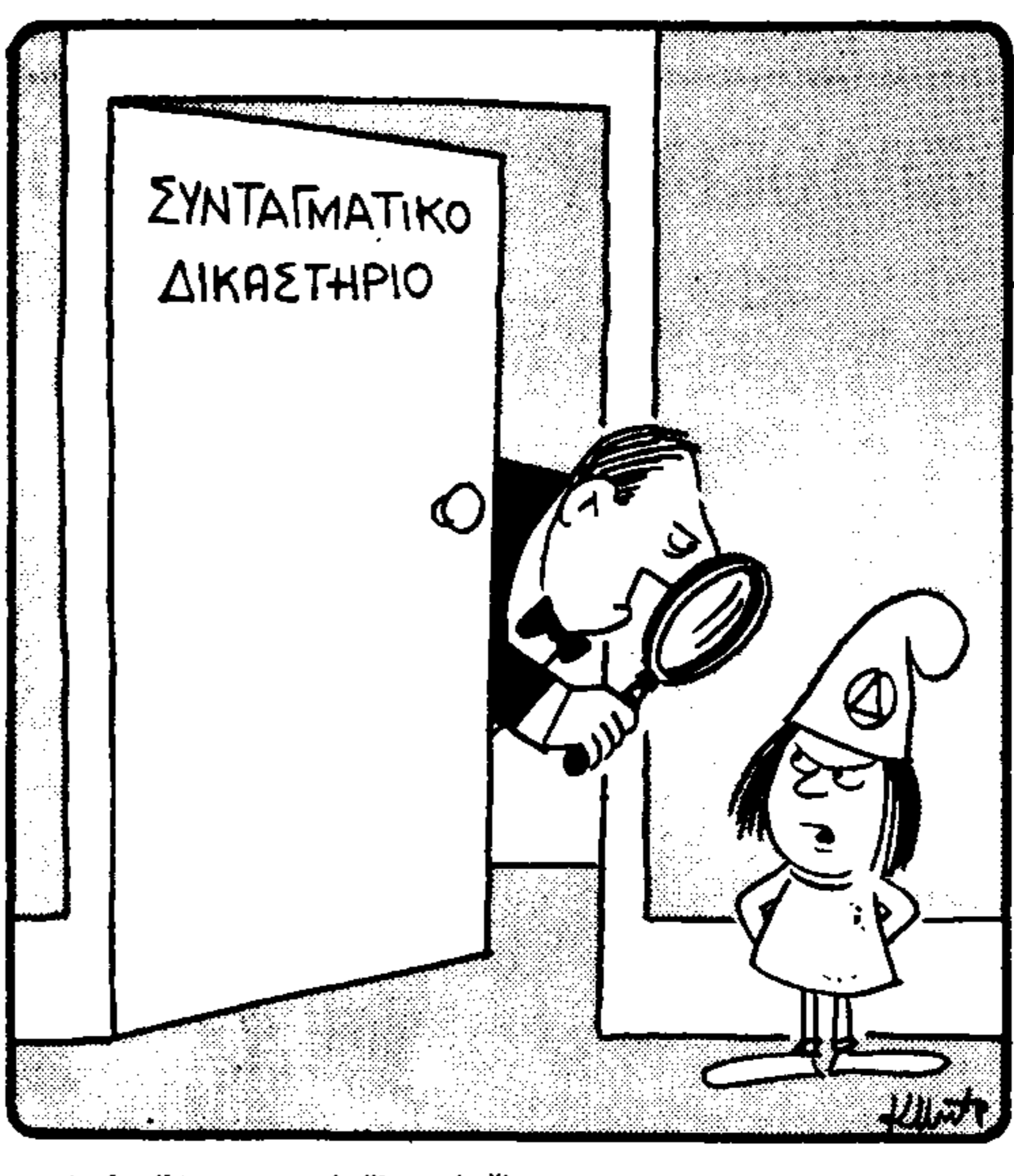
Μπά; 'Αρχισε κι' άλλος ο έλεγχος;

Αλλά συστήματα, λέει, του προσημένου ονόματος, που θεωρούνται, ωστόσο, σήμερα παραρτημένα μερυστά στις νέες μεθόδους που έχουν οργανώσει οι υπερωμένοι — ο ρόλος του κινδύνου τον κόσμο πέρας σε άλλους — για να προστατευθούν τα συμφέροντά τους. Δεν είναι, φυσικά, η έντολη επέμβαση, αλλά αυτή γίνεται πάντα με... Ισολογική βάση, εν όψει της καταρτισμένης. Έλαβετε και της αυτοδύναμης των λαών. Ποτέ οι σημερινές υπερω-